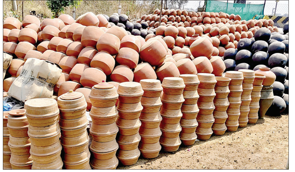
उन्हाळ्याची चाहूल लागताच गरिबांचा फ्रिज बाजारात दाखल झाला असून महिला भगिनी खरेदी करताना दिसत आहे