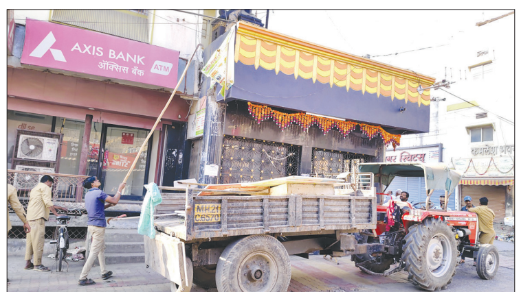
जालना शहर नगरपालिकेचेवतीने कोर्टाच्या आदेशानुसार रोडवर दुकानदारांचे बोर्ड व बॅनर काढण्यात आले

महानगरपालिकेकडे आतापर्यंत अतिक्रमण आणि रस्त्यांवरील अडथळ्यांबाबत किती तक्रारी प्राप्त झाल्या? त्या तक्रारींवर कोणती कारवाई