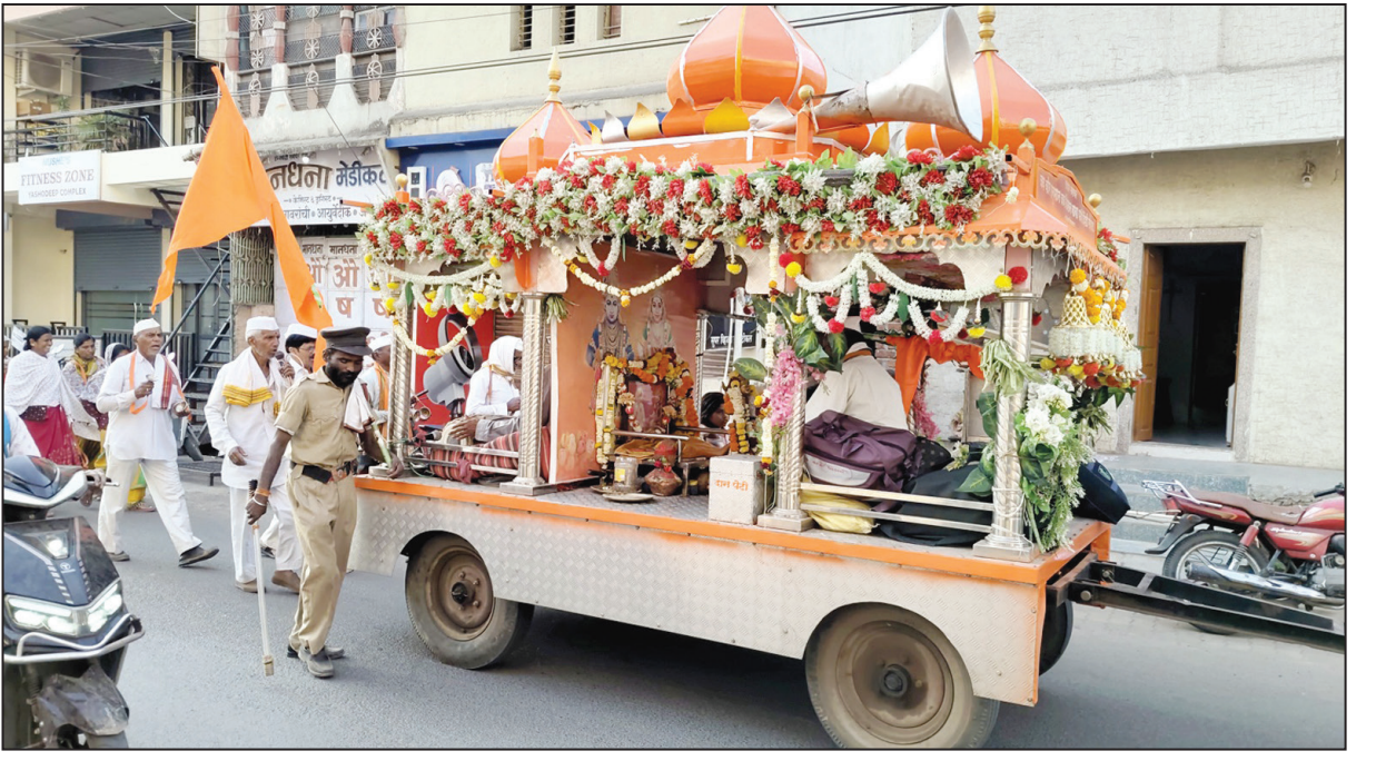
नाथ षष्ठी निमित्त पैठणला रखरखत्या उन्हात देवाचे नाव स्मरण करत भक्तगण नाथाचे दर्शन घेण्यास पैठणला खाना होत आहे