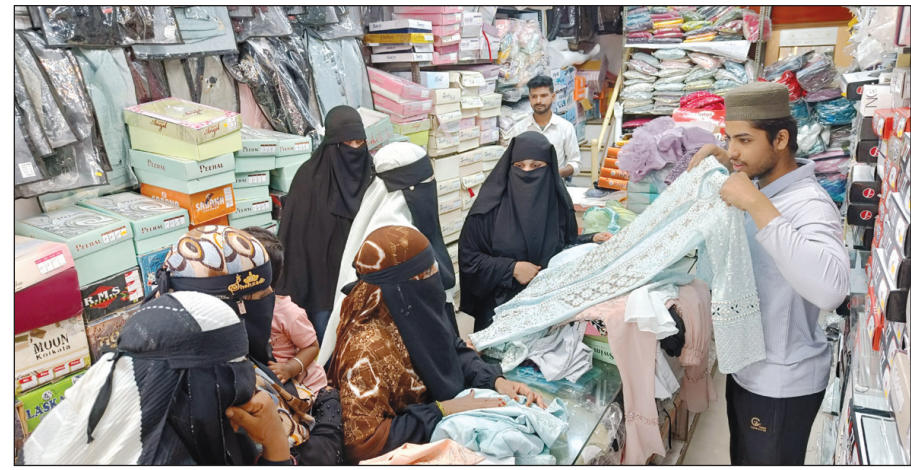
पवित्र रमजान महिना सुरु असून ईद साठी काही दिवस शिल्लक असून शहरातील बाजारात कापड खरेदीसाठी महिलांची गर्दी होत आहे