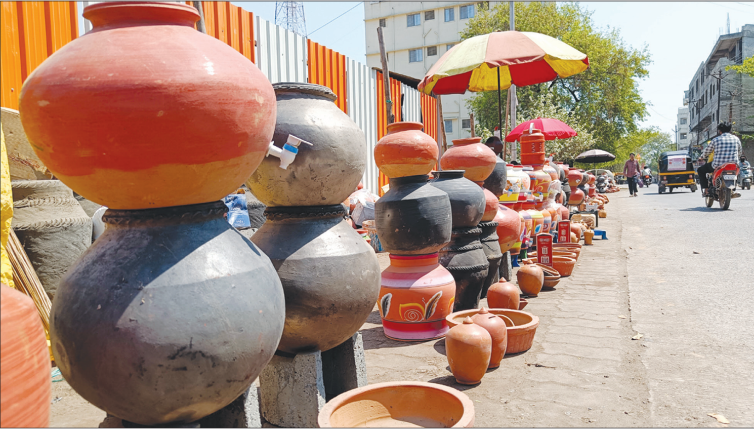
उन्हाळ्याची चाहूल लागतात गरिबांचा फ्रिज म्हणून ओळखल्या जाणारा माठ बाजारात विविध प्रकारामध्ये उपलब्ध झालेले आहेत.