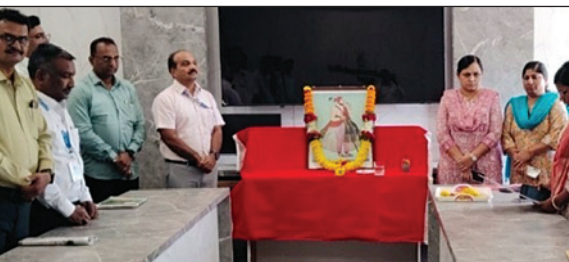
महाराज यांना अभिवादन केले.