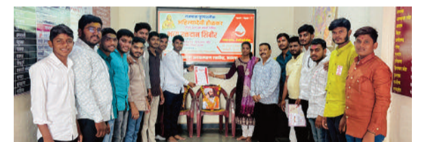
करून सामाजिक बांधिलकीचे दर्शन घडविले. रक्तदान हे श्रेष्ठदान मानले जाते आणि गरजू रुग्णांसाठी रक्ताची आवश्यकता लक्षात घेऊन अनेक युवक, नागरिक व समाजबांधवांनी स्वयंस्फूर्तीने सहभाग नोंदविला. राजमाता अहिल्यादेवी होळकर यांच्या लोककल्याणकारी कार्याचा आदर्श समोर ठेवत समाजोपयोगी उपक्रमांच्या

मंठा । प्रतिनिधी राजमाता पुण्यश्लोक अहिल्यादेवी होळकर यांच्या ३०१ व्या जयंतीनिमित्त श्रीमंत सुभेदार महाराज होळकर प्रतिष्ठान, मंठा जिल्हा जालना यांच्या वतीने रविवार (दि. ३१ मे २०२६) रोजी ओम रामेश्वरराय नमः महादेव (केदारनाथ) मंदिर, सुगंधा नगर, मंठा येथे भव्य रक्तदान शिबिराचे आयोजन करण्यात आले. समाजहिताची भावना जोपासत आयोजित करण्यात आलेल्या या रक्तदान शिबिराला नागरिकांचा उत्स्फूर्त प्रतिसाद लाभला. शिबिरामध्ये एकूण ५१ रक्तदात्यांनी रक्तदान