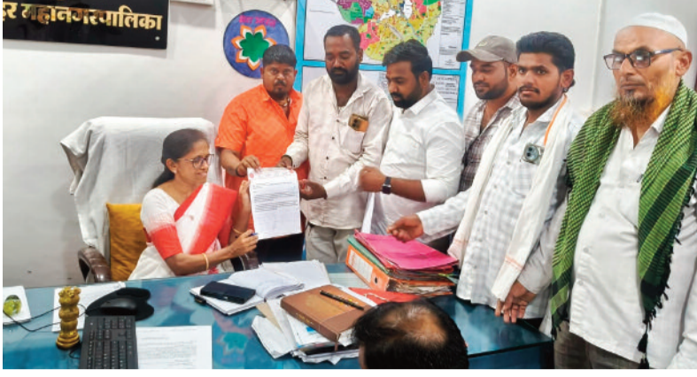
निवेदनात म्हटले आहे की, सुंदरनगर महिन्यांपासून गळती अवस्थेत असून भागातील पाण्याची टाकी अनेक दररोज हजारो लिटर पिण्याचे पाणी वाया

पावसाळा तोंडावर आलेला असताना जालना शहरातील सुंदरनगर परिसरातील पाणीपुरवठा, अंडर ड्रेनेज आणि स्वच्छतेच्या गंभीर समस्यांमुळे नागरिकांचे जीवन अक्षरशः त्रस्त झाले आहे. वारंवार तक्रारी करूनही महानगरपालिकेकडून कोणतीही ठोस कारवाई होत नसल्याने नागरिकांमध्ये तीव्र संतापाची भावना निर्माण झाली असून सार्वजनिक एकात्मता सामाजिक संघटनेच्या वतीने महानगरपालिका प्रशासनाला निवेदन देऊन तात्काळ उपाययोजनांची मागणी करण्यात आली आहे. संघटनेने दिलेल्या